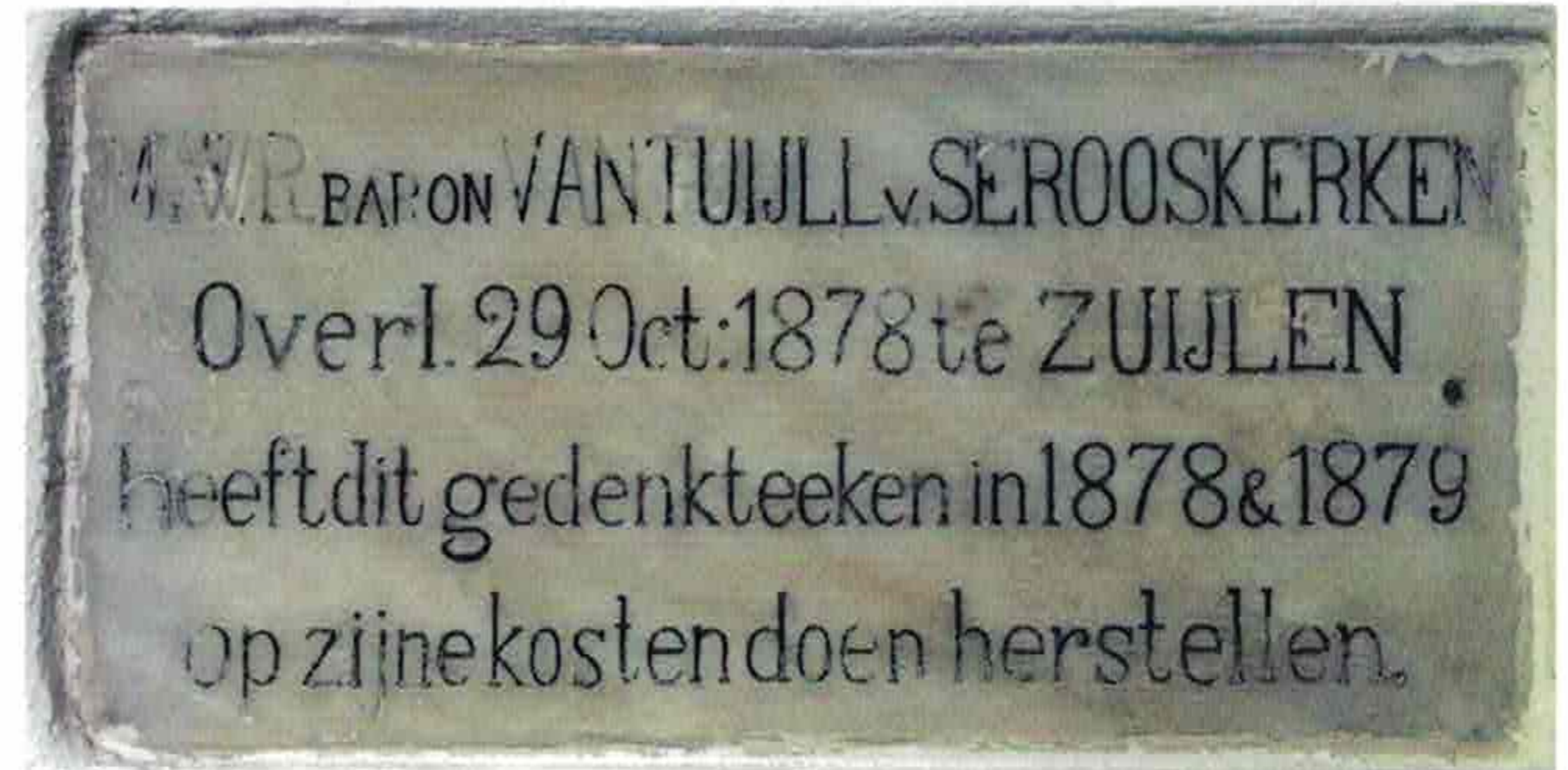
Gedenksteen van een eerdere restauratie.

tombe op en af klauterde, met alle schade van dien. In 1904 droeg een andere verre nazaat van de familie, gravin van Bylandt, bij aan de restauratie van het koor om het beeld te beschermen.