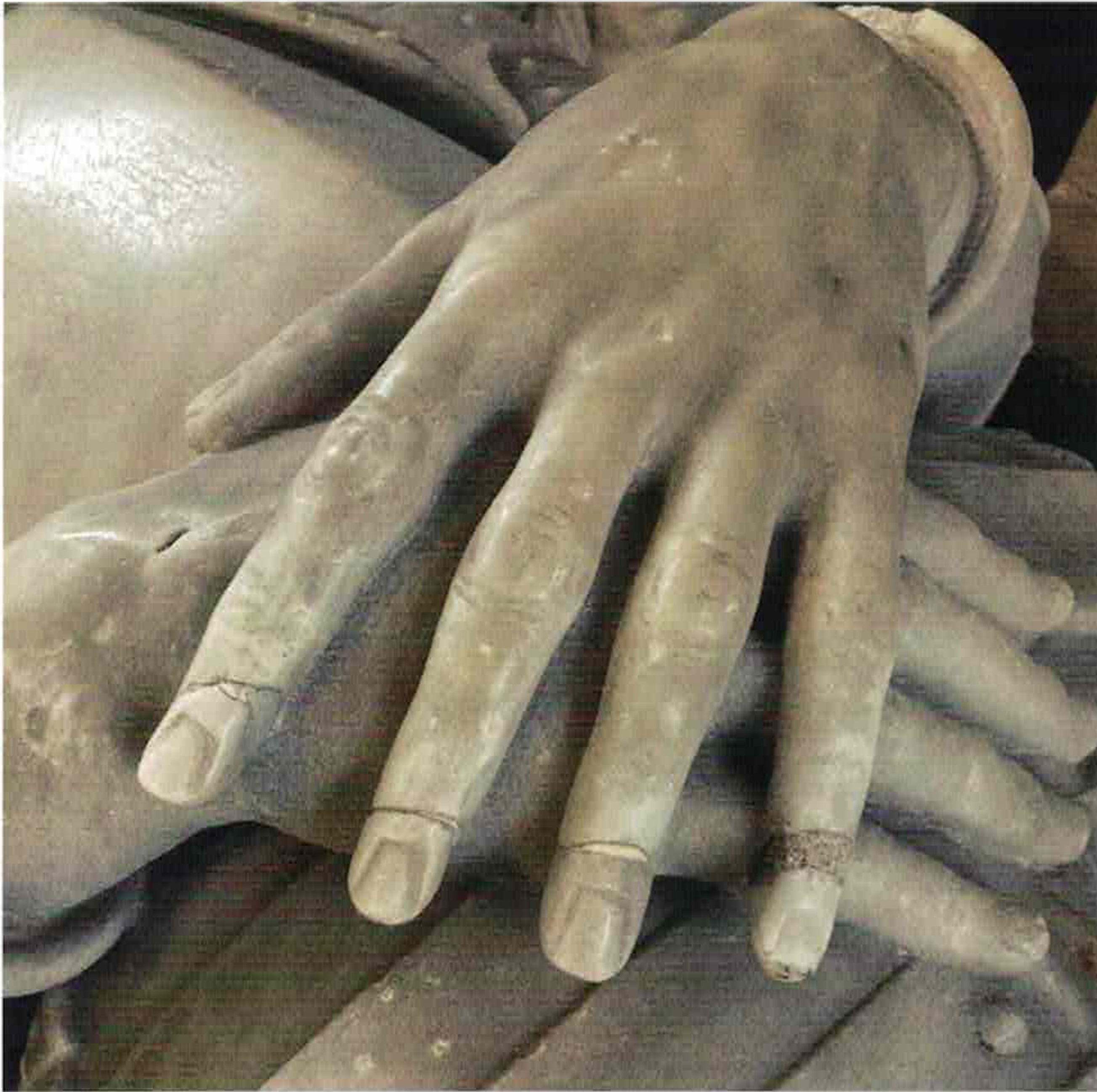
Eerdere reparatie van de vingertoppen.