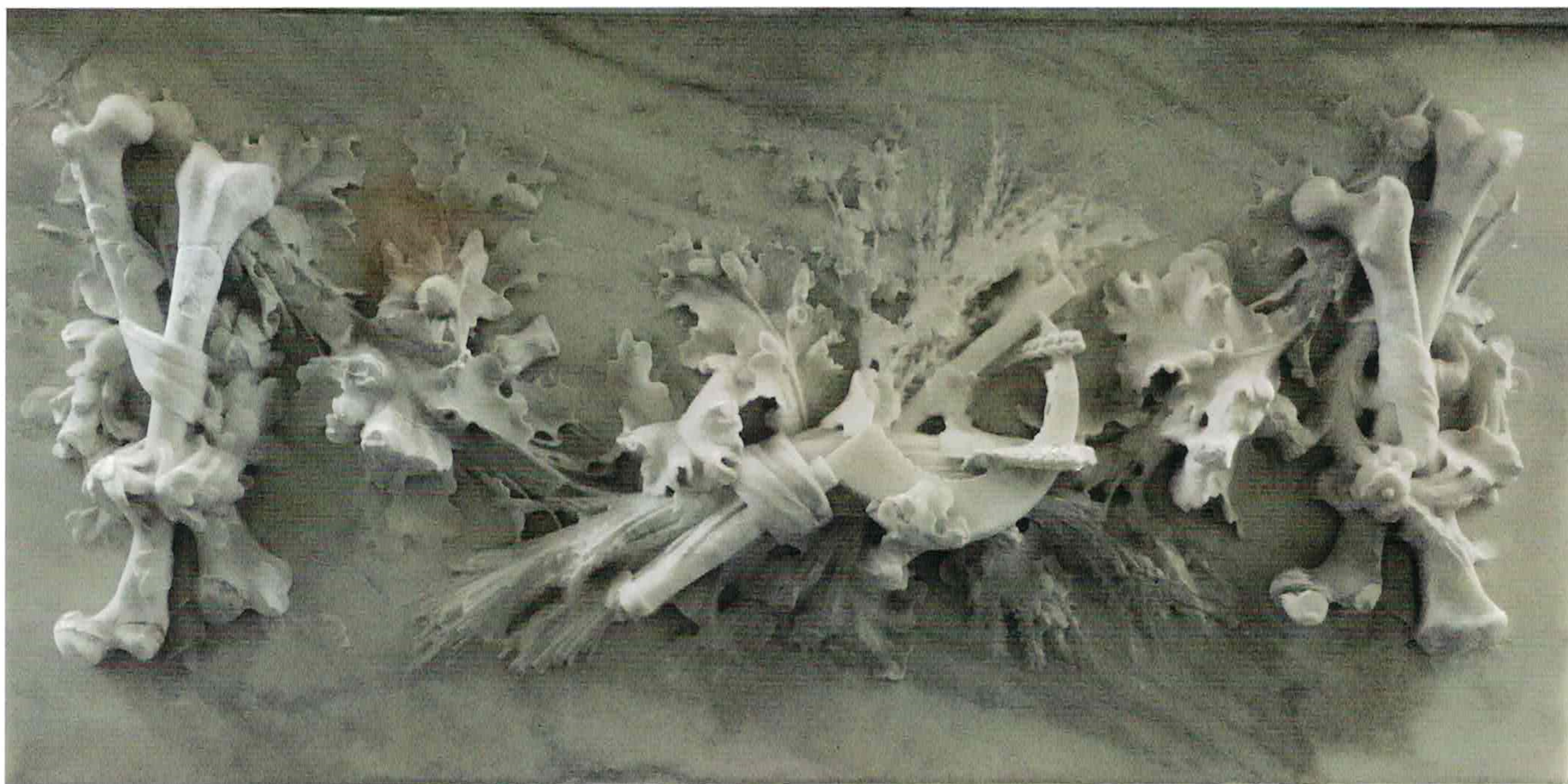
Verfijnd beeldhouwwerk op het front van de graftombe.