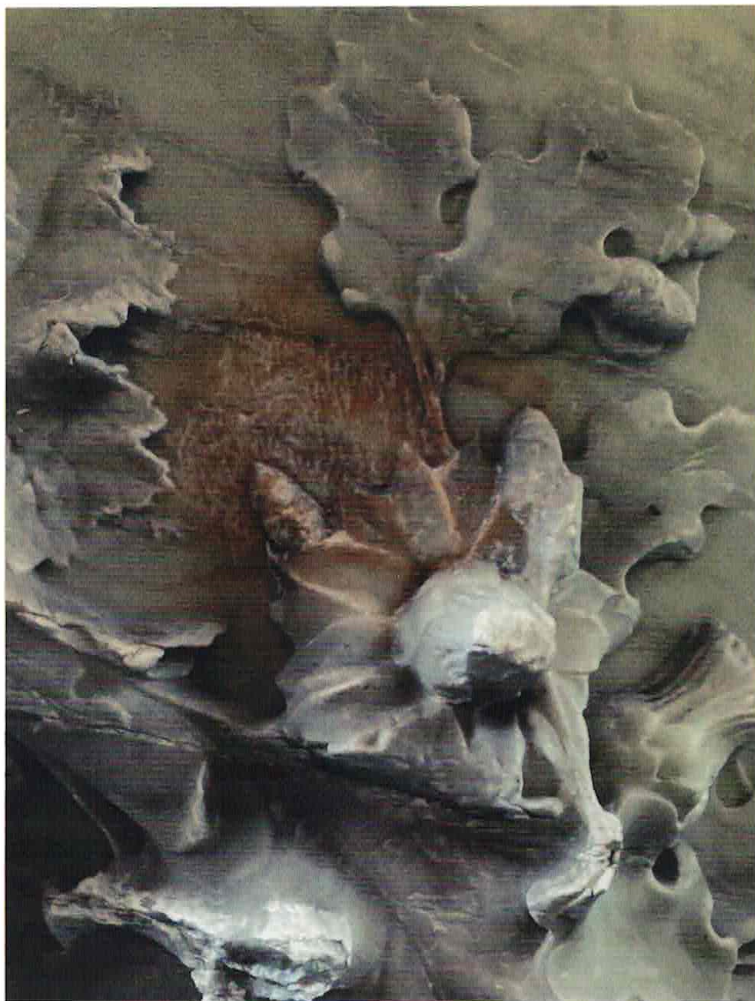
Verkleuring door roestvorming van een ijzeren dook.

Als je dichterbij de tombe komt, zie je een oranjebruine vlek op het reliëf aan de voorkant, mogelijk veroorzaakt door een roestende dook (een verbindingspen waarmee de verschillende marmeren delen bij elkaar worden gehouden), een afgebrokkeld stukje marmer op een hoek van de tombe, een barst door het beeld, nog een barst. Maar het opvallendst